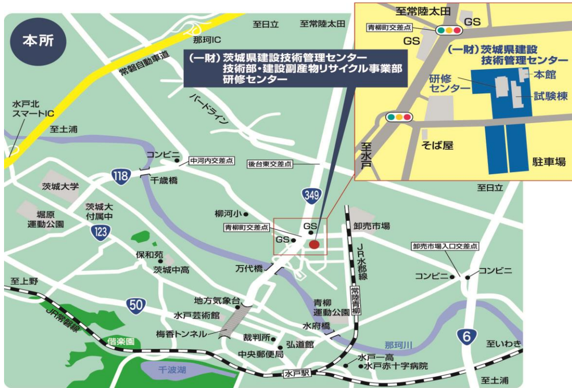
【会場配置図】 一般財団法人茨城県建設技術管理センター 所在：水戸市青柳町 4195