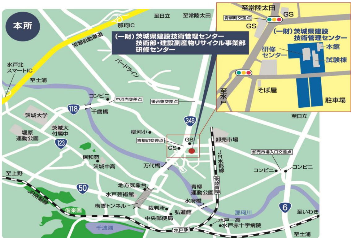
【会場配置図】 一般財団法人茨城県建設技術管理センター 所在：水戸市青柳町 4195